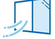
施設内換気の励行