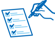
チェックイン時の問診票記入へご協力ください