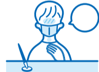
体調不良時はお申し出ください