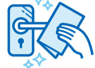
館内共用部の消毒の強化