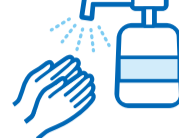
アルコール消毒液の設置