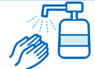
アルコール消毒へのご協力をお願いします