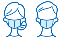
施設利用時のマスク着用にご協力ください